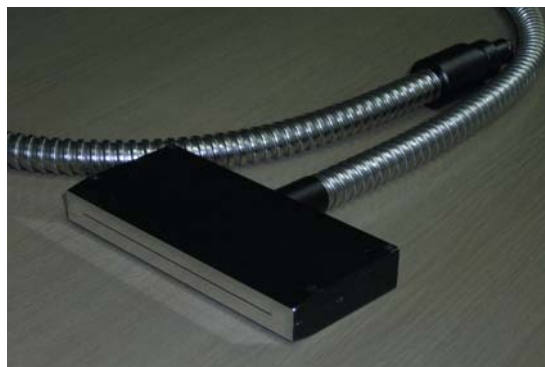
スリット式ライトガイド