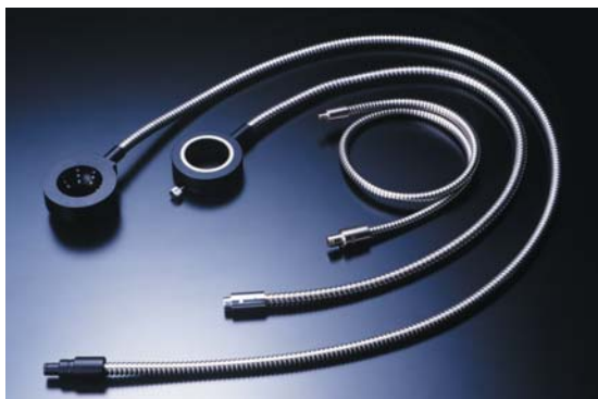
リング型ライトガイド